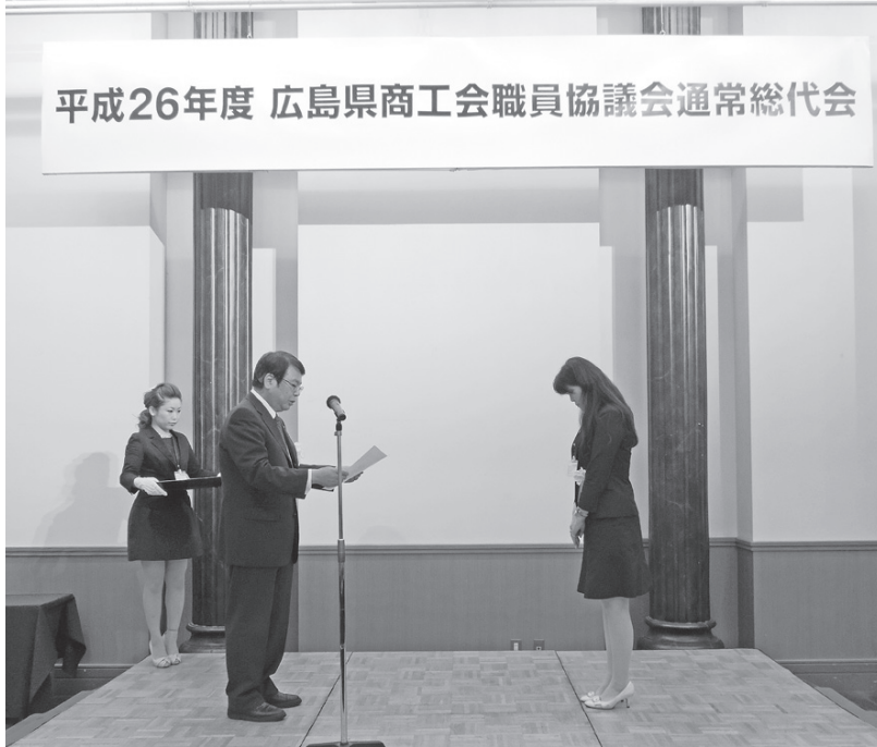
平成 26 年 6 月 17 日 勤続 20 年表彰式の模様